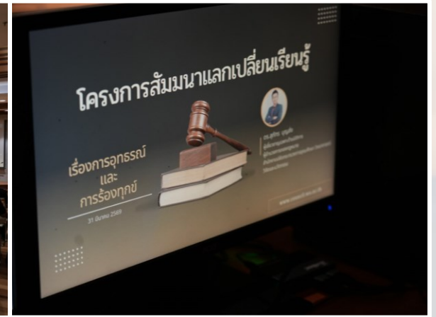
ภาพ กิจกรรมหัวข้อ “โครงการสัมมนาแลกเปลี่ยนเรียนรู้เรื่องการอุทธรณ์และการร้องทุกข์”