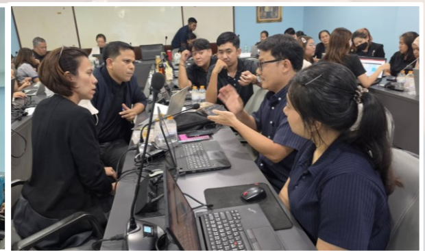
ภาพ กิจกรรมหัวข้อ “โครงการการพัฒนาศักยภาพบุคลากรด้านธรรมาภิบาลข้อมูล (Data Governance)”