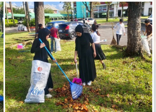
ภาพ กิจกรรมหัวข้อ “วลัยลักษณ์รักษ์สิ่งแวดล้อมพัฒนาภูมิทัศน์สืบสานปณิธาน พระผู้ทรงเป็นแม่และครูแห่งแผ่นดิน”